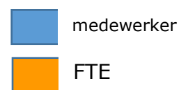
Overzicht aantal medewerkers en FTE per team

Zichtbaar is dat het aantal medewerkers fluctueert van minimaal 6 tot maximaal 8. De "uitschieter" bij afdeling Boveneindje wordt veroorzaakt door de administratieve indeling van de nachtdienst bij deze afdeling.