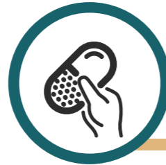
MIC meldingen wijk